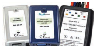
Holter ECG Grabadoras Monitores Holter DMS 300-3A, 300-4A y 300-7