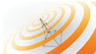
Sistema Holter por Satélite Transferencia directa de datos de ECG Holter a través de Internet