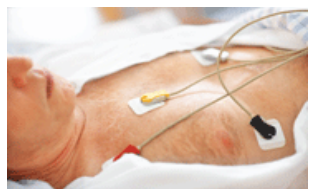
ECG de 12 derivaciones en reposo Suite integral de funcionalidades adicionales