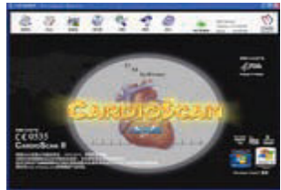
Holter Analysis Software Escaneo avanzado de ECG con CardioScan Premier 10, 11 y 12